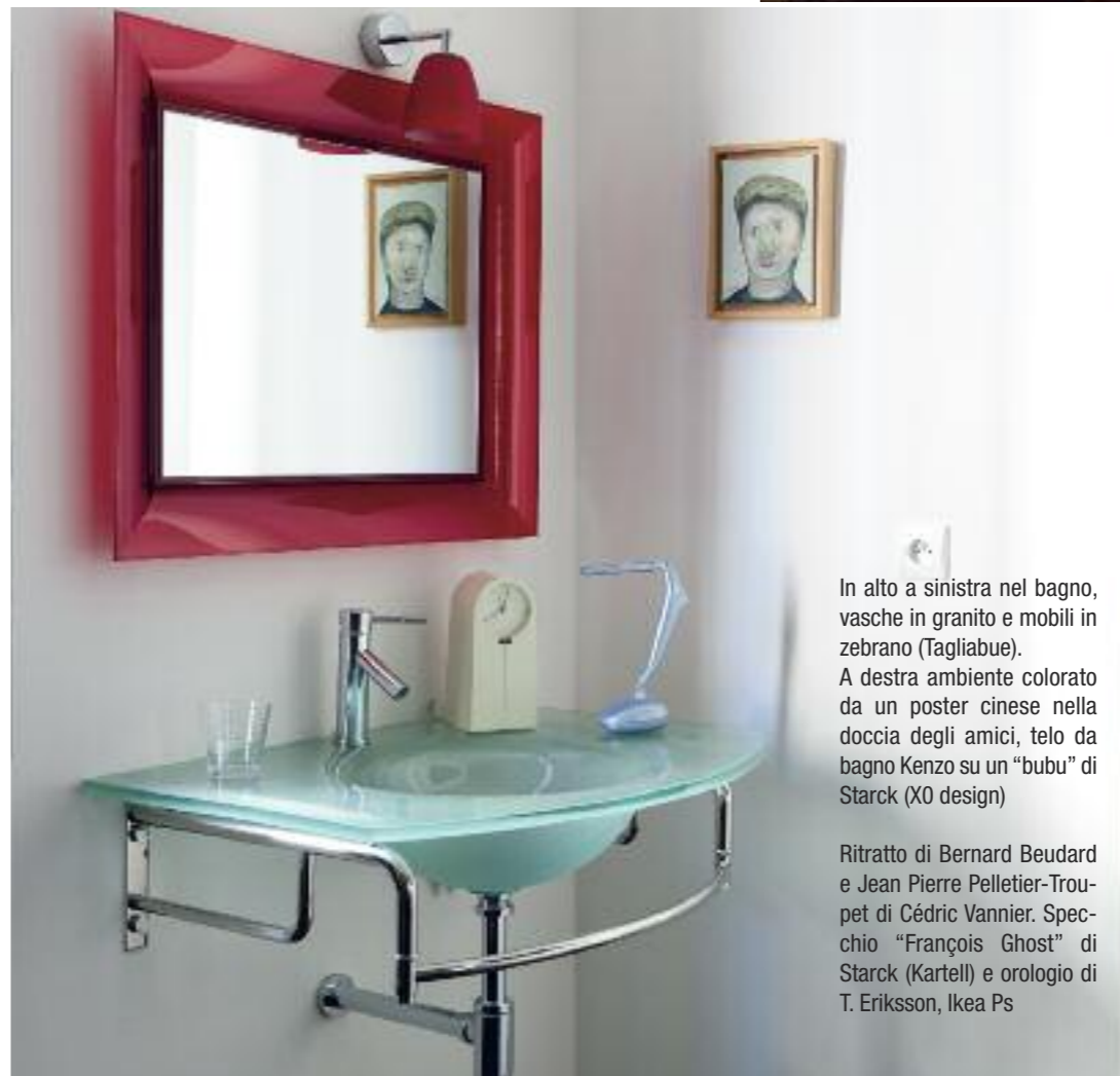
In alto a sinistra nel bagno, vasche in granito e mobili in zebrano (Tagliabue). A destra ambiente colorato da un poster cinese nella doccia degli amici, telo da bagno Kenzo su un "bubu" di Starck (XO design)